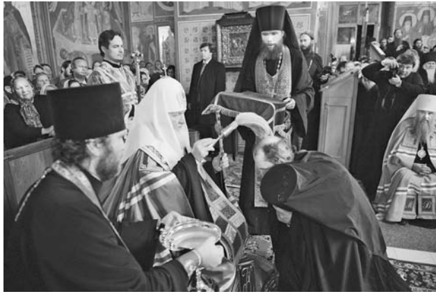
и о значении Благовещенского храма в духовном окормлении верующих в годы богоборчества и насаждения атеизма.

Далее Первоиерарх РПЦ обратился к верующим со словом. Он сказал о роли Козельска в истории России