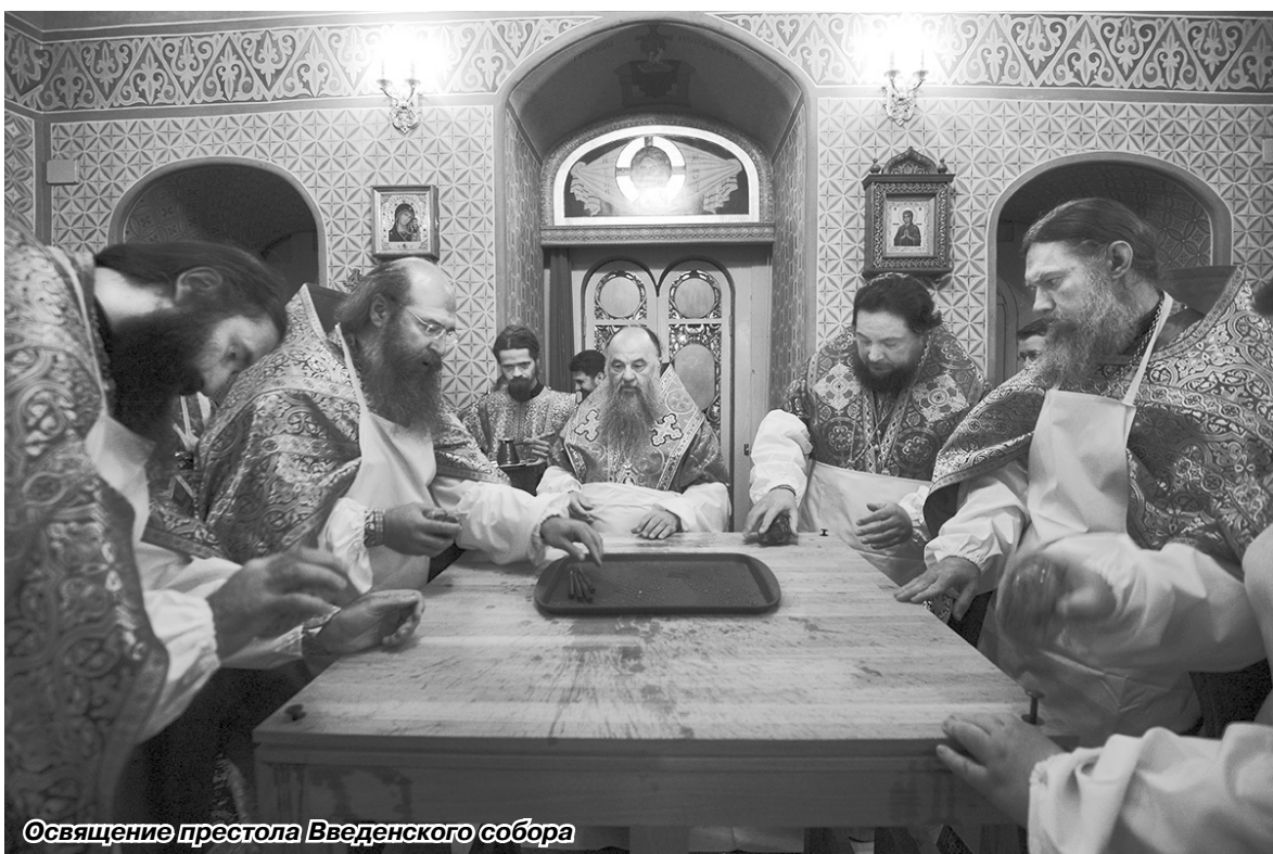
Освящение престола Введенского собора

Во вторник, 22 октября, Патриарх Московский и всея Руси Кирилл прибыл во Введенский ставропигиальный мужской монастырь Оптиной пустыни. Это посещение связано с 25-летием со дня прославления в лике святых великого оптинского старца Амвросия.