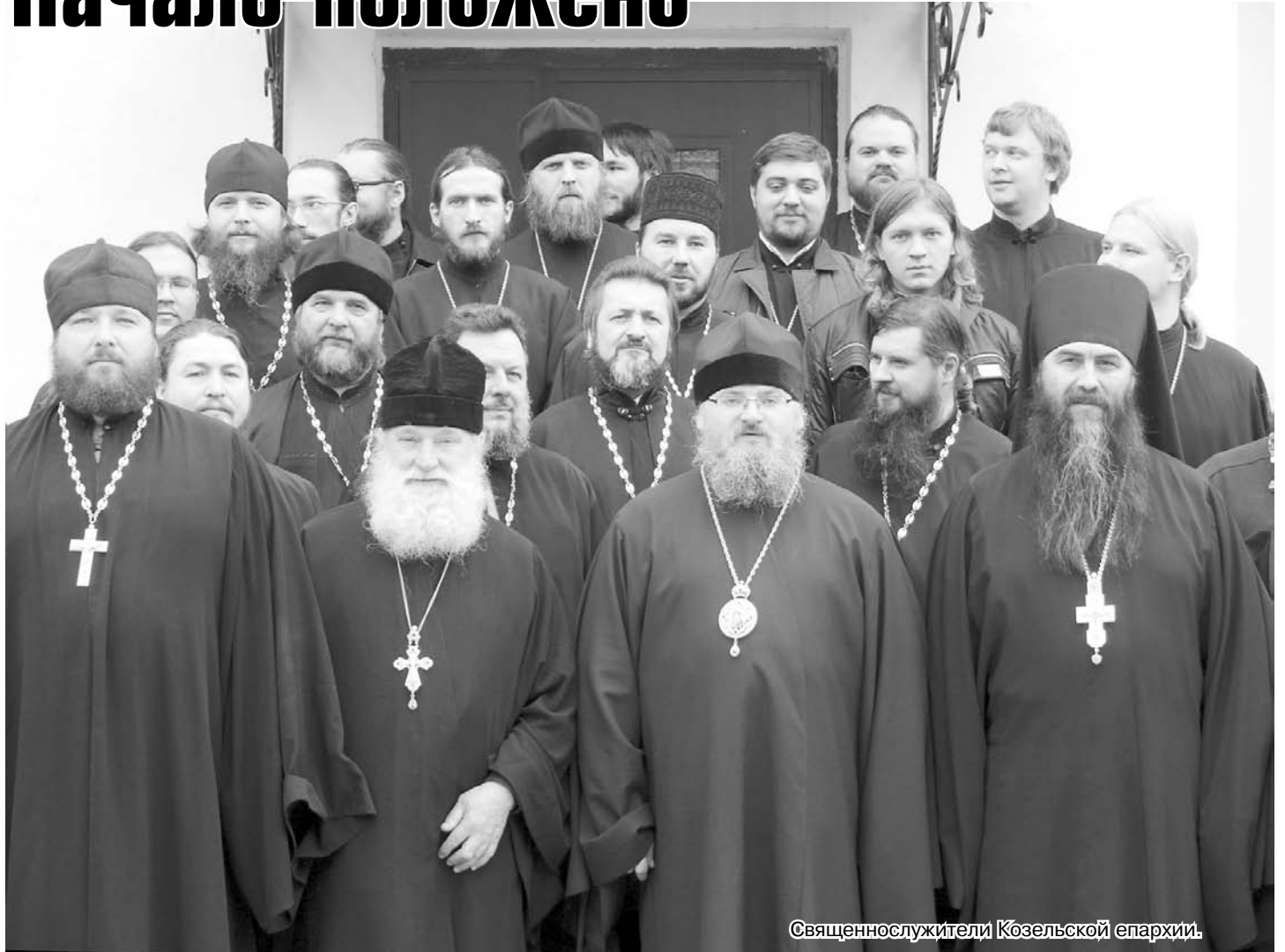
Священнослужители Козельской епархии.

В субботу, 5 октября, в зале заседаний Калужской митрополии прошло собрание духовенства Козельской епархии. Встречу возглавил правящий архиерей — епископ Никита.