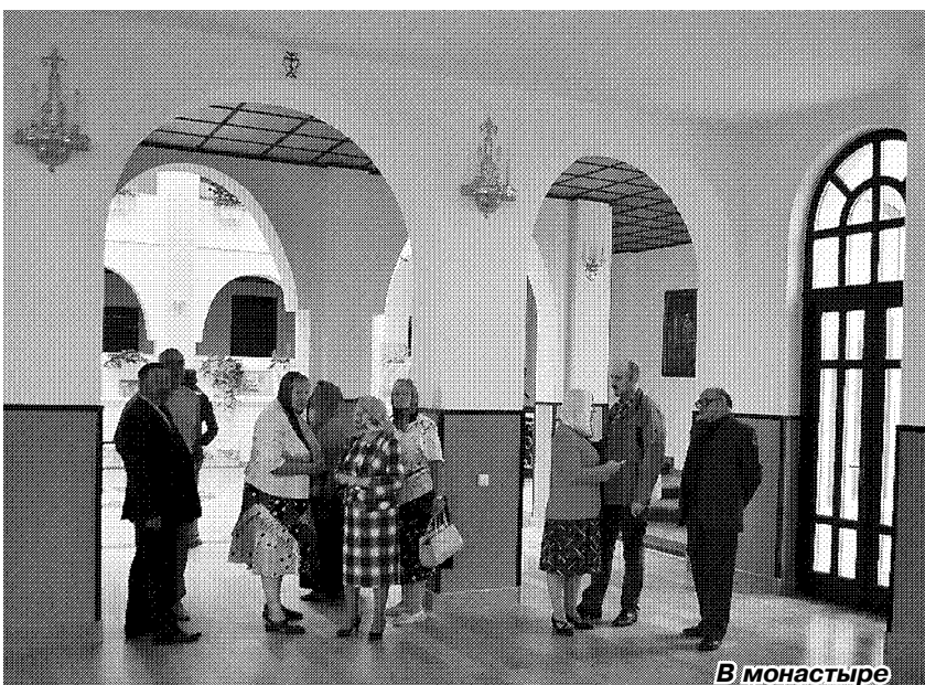
В пятницу, 27 июля, на семинар в Козельске собрались наши коллеги из соседних районов.

Перед тем как приняться за обсуждение профессиональных вопросов, работники районной администрации устроили работникам пера обзорную экскурсию по городу — похорошевшему за последние годы Козельску есть чем похвалиться перед своими гостями.