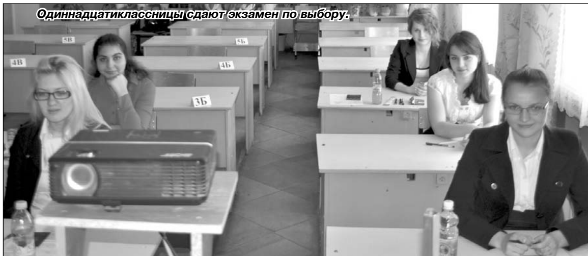
Одиннадцатиклассники сдают экзамен по выбору.

«НГ» довольно подробно писал о ходе государственной (итоговой) аттестации 9-классников и сдаче единых государственных экзаменов 11-классниками. Теперь настало время подвести итоги.