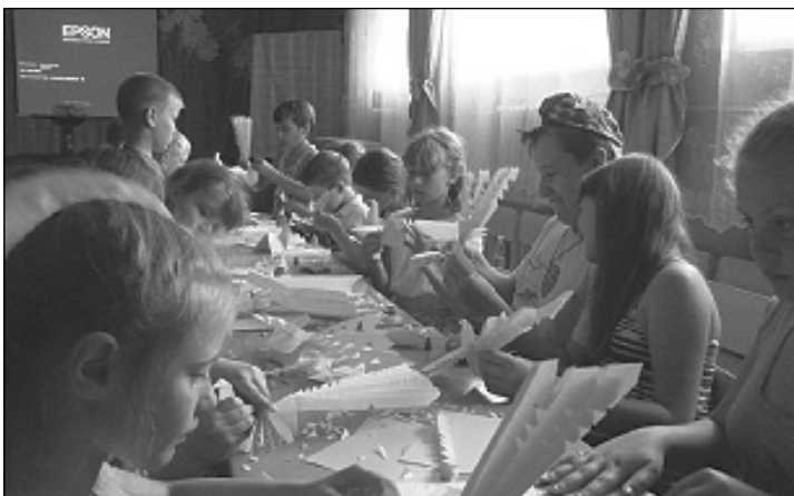
С 1 июня для учащихся 1–6 классов сосенской средней школы №1 работает оздоровительный лагерь дневного пребывания «Солнышко».

Приоритетные направления деятельности лагеря — оздоровительная, образовательная и развлекательная. Для ребят это и пребывание на свежем воздухе, и проведение