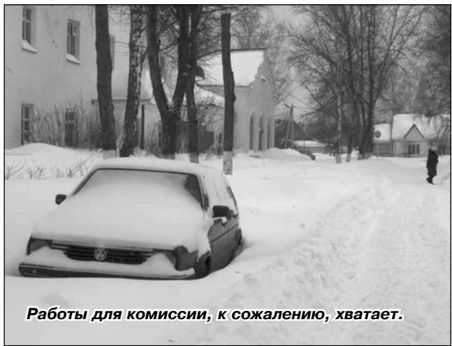
Работы для комиссии, к сожалению, хватает.

На большее в бюджете денег нет, а проблем очень много. Как к депутату, с жалобами на плохое состояние