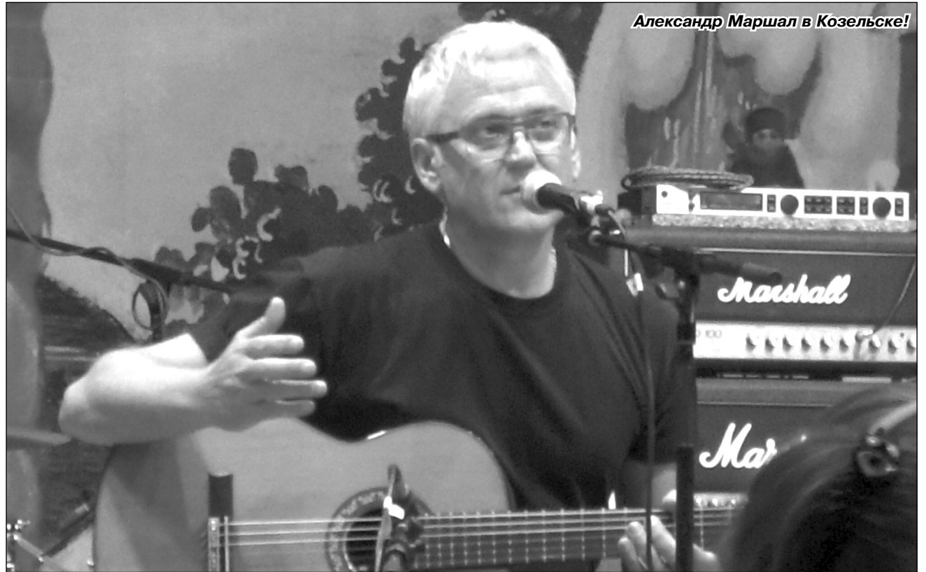
Александр Маршал в Козельске!

Давно уже ни для кого не секрет, что многие знаменитости, в том числе звезды шоу-бизнеса, являются верующими православными людьми. Некоторые более открыто и активно исповедуют свою веру, другие стараются не привлекать внимание поклонников к этому аспекту своей жизни. Насколько сильна, глубока и осознанна вера тех или иных публичных людей – судить, конечно, не нам. Однако сам факт распространения веры Христовой в «звездных» кругах не может не радовать рядовых христиан.