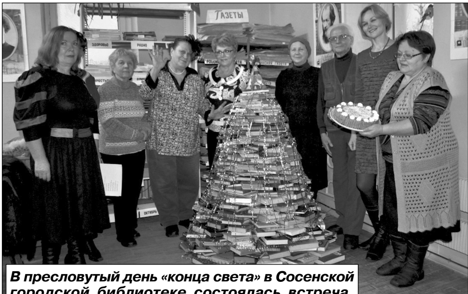
В пресловутый день «конца света» в Сосенской городской библиотеке состоялась встреча, посвящённая проведению старого года.

Неизгладимое впечатление произвела ёлочка, ко-