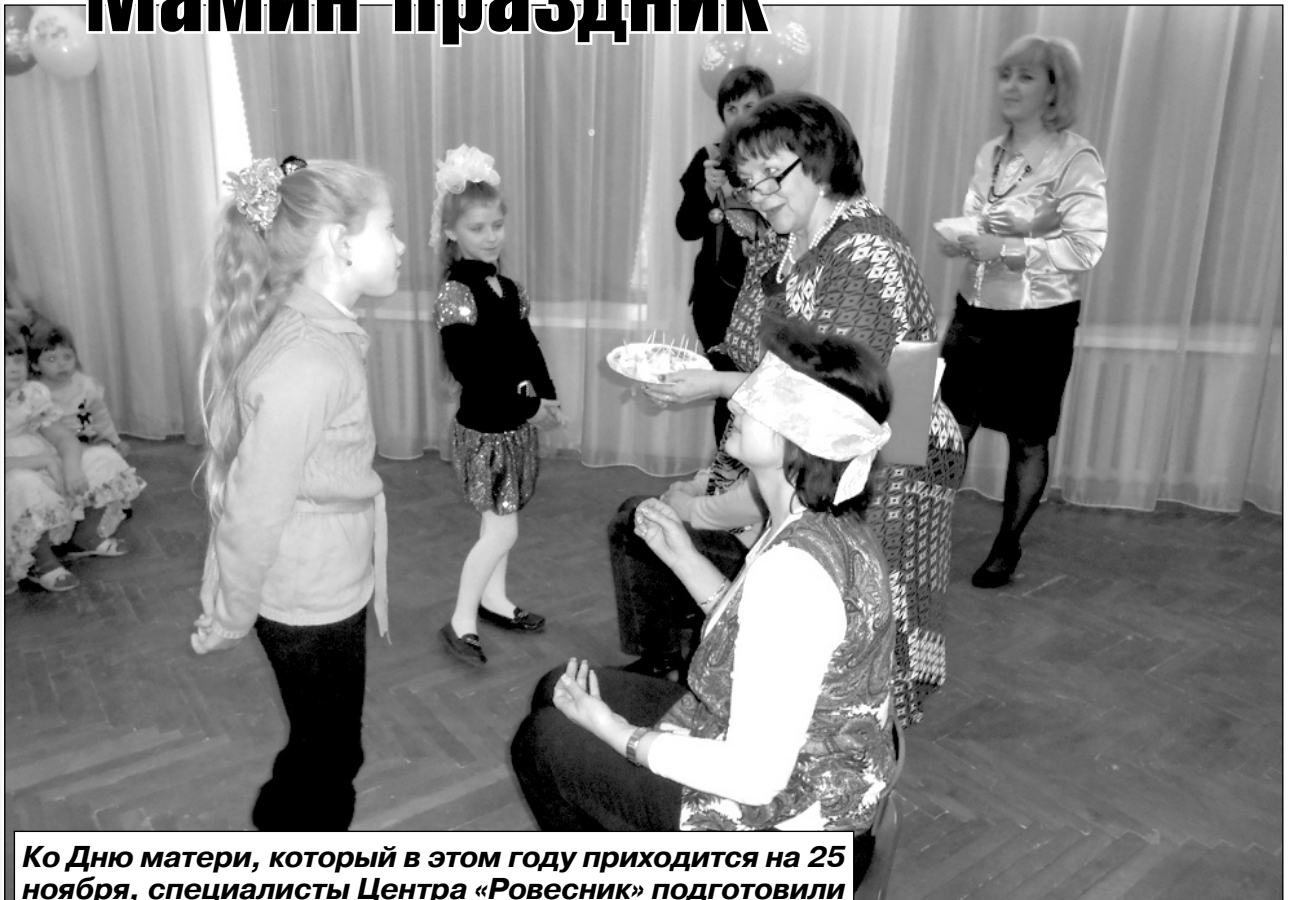
Ко Дню матери, который в этом году приходится на 25 ноября, специалисты Центра «Ровесник» подготовили и провели добрый и трогательный праздник.

В пятницу, 23 ноября, в зрительном зале на втором этаже собрались все его участники. Помимо мам и бабушек, на мероприятие не поленились прийти даже папы, которые, впрочем, были в меньшинстве. А на почетных «артистических» местах в двух первых рядах разместились их чада, которые с волнением и трепетом ожидали своих выступлений. Было видно, что им хочется сделать приятное самым дорогим на свете людям!