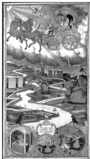
Фото: икона Вознесения пророка.

Иконописная традиция изображает Илию, который является одним из величайших пророков Ветхого Завета, возносящимся на небо в колеснице. Она запряжена четырёхкрылатых коней и охвачена пламенем.