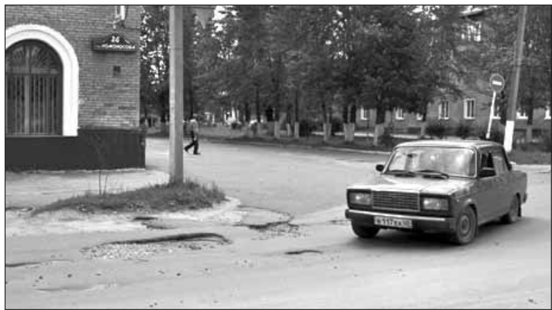
покрыт гудроном и только потом — заасфальтирован. Со своей стороны считаю необходимым победить